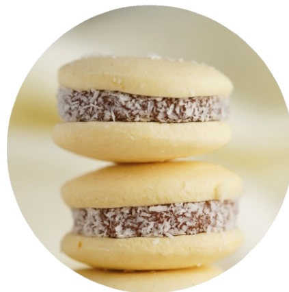
ALFAJOR DE MAICENA