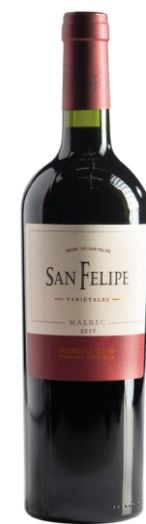
SAN FELIPE MALBEC