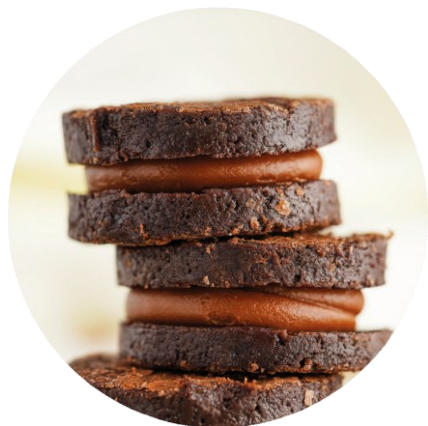
ALFAJOR DE BROWNIE

El alfajor de brownie artesano es una irresistible y tentadora combinación de dos capas suaves de bizcocho de chocolate tipo brownie, unidas por un generoso relleno de dulce de leche. Una deliciosa experiencia que deleitará a todos los amantes del chocolate y dulce de leche.