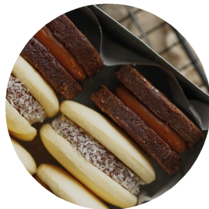
PACK DE 6 ALFAJORES ARTESANOS MALVÓN