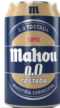
MAHOU TOSTADA 0,0 (33 CL.)