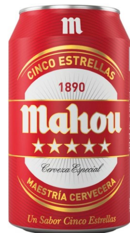
MAHOU CINCO ESTRELLAS (33 CL.)