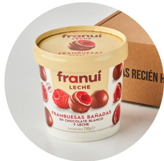
CHOCOLATE CON LECHE