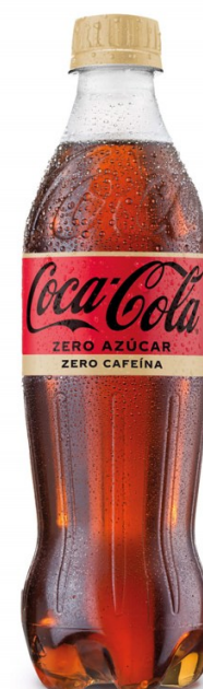
COCA-COLA ZERO ZERO