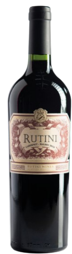
RUTINI CABERNET MALBEC